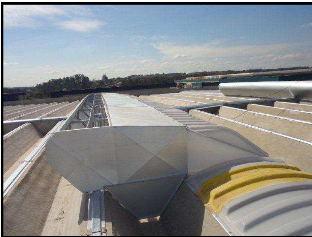
EXAUSTOR NATURAL TIPO L 630 ACRÍLICO PRISMÁTICO COM PASSARELA REFORÇADA LENTE PRISMÁTICA CONTÍNUA SEM VENTILAÇÃO VÃO LUZ 1,25 m