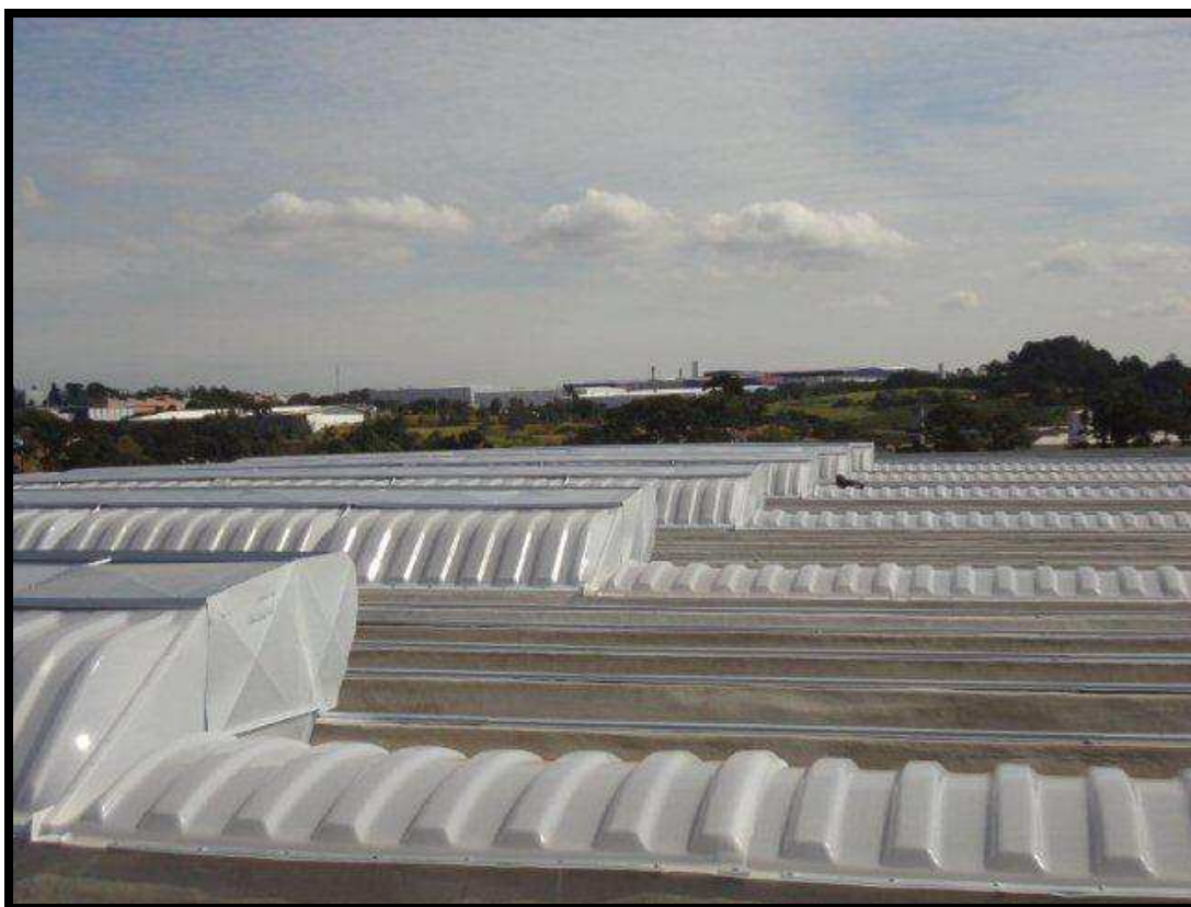
DOMO TIPO L 630 EM ACÍLICO PRISMÁTICO